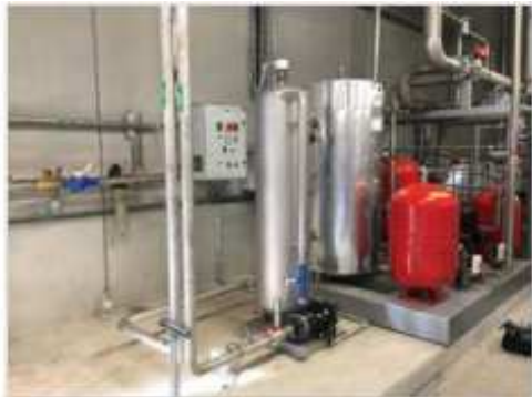
Dispositif de traitement de l'eau de lavage Ozone service http://www.ozone-service.fr/pagefood.html