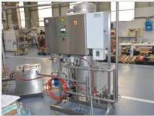
Dispositif de traitement d'eau de process. Ozone service http://www.ozone-service.fr/pageeau propre.html