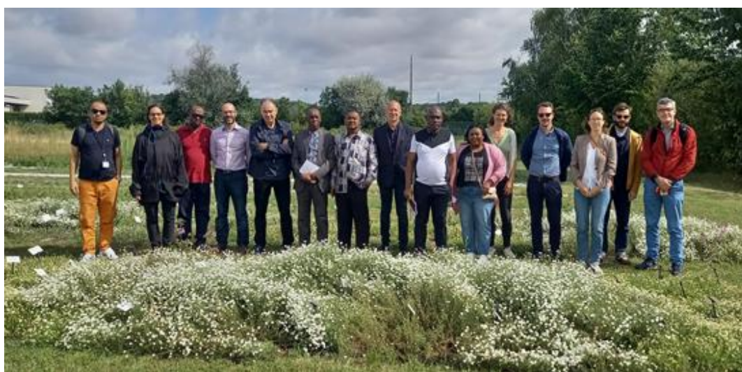
Visite de terrain de l'Office comorien des produits de rente (OCPR) à Milly-la-Forêt, 1 er août 2023

Contact : krisztina.albert@franceagrimer.fr