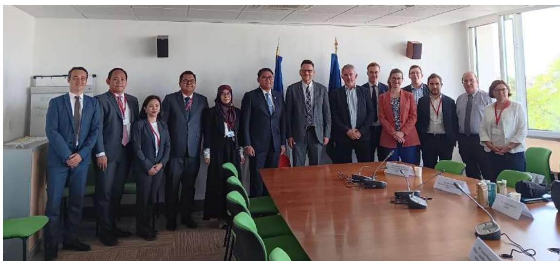
Rencontre entre les professionnels français, FranceAgriMer et la délégation indonésienne

Le 4 septembre dernier, FranceAgriMer a organisé à Paris une rencontre de plusieurs filières françaises avec une délégation indonésienne menée par le vice-ministre indonésien M. Sudaryono. Dans la perspective du nouveau programme indonésien de restauration scolaire, le vice-ministre a ainsi exprimé les besoins de son pays auprès des représentants français des secteurs laitier, bovin et de la génétique animale. L'Indonésie souhaite développer son élevage local et a montré de l'intérêt pour l'expertise française en la matière.