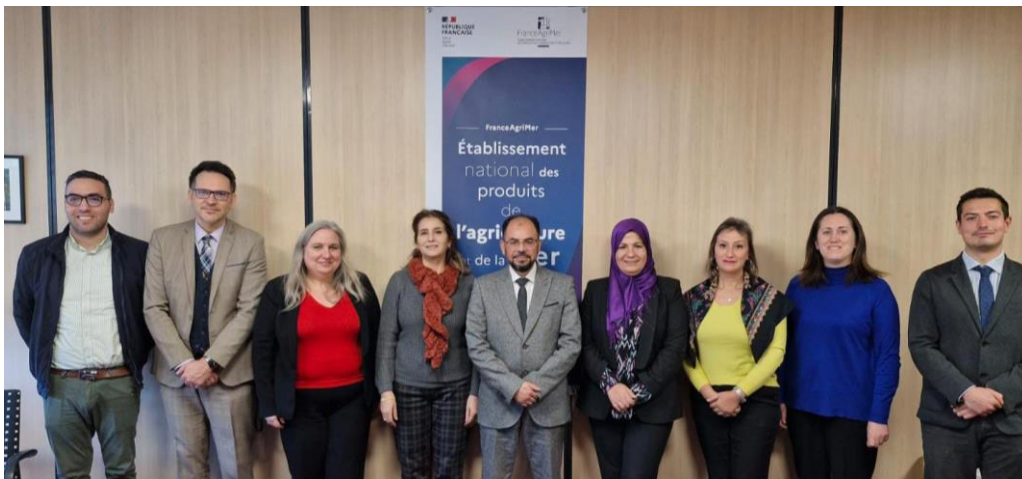
Le directeur de la DGFIOP, la directrice de l'APIA, la directrice générale adjointe de FranceAgrimer et leurs collaborateurs à l'occasion de la visite de la délégation tunisienne à Montreuil.

FranceAgriMer a accueilli une délégation tunisienne dans le cadre du Programme de relance de l'investissement et de modernisation des exploitations agricoles (PRIMEA). Ce projet vise à améliorer le dispositif d'octroi des primes à l'investissement agricole en Tunisie. La délégation était composée des membres de la Direction générale du financement des investissements et des organismes professionnels (DGFIOP) ainsi que de l'Agence de promotion des investissements agricoles (APIA) du ministère tunisien en charge de l'agriculture. La visite d'étude portait sur la gestion et le suivi des aides agricoles via des rencontres avec l'Agence des services et de paiement (ASP) et FranceAgriMer, ainsi que sur le registre des actifs agricoles qu'elle a pu découvrir auprès des Chambres d'agriculture françaises.