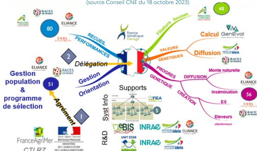
Conseil de la CNE du 18 octobre 2023. Génétique des ruminants action et financement