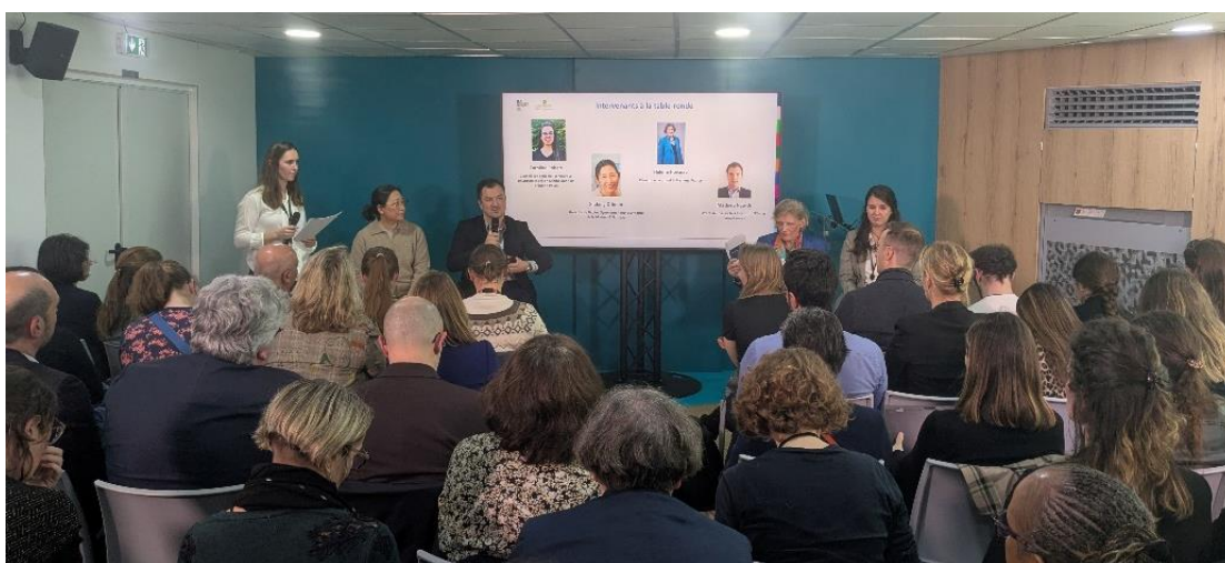
Table ronde « Les opportunités du marché chinois pour les produits agricoles et agro-alimentaires français ».

Près de 60 personnes ont participé à la table ronde « Les opportunités du marché chinois pour les produits agricoles et agro-alimentaires français », qui s'est tenue le 24 février dernier au SIA. À cette occasion, Business France a présenté les premiers résultats d'une étude commanditée par FranceAgriMer sur le marché chinois pour cinq filières : céréales (dont préparations à base de céréales) et produits de la minoterie ; fruits et légumes et préparations associées ; boulangerie – viennoiserie – pâtisserie ; produits d'épicerie et préparations alimentaires ; produits de la mer. Un éclairage a été apporté par la conseillère aux affaires agricoles adjointe de l'ambassade de France à Pékin. Les participants ont bénéficié aussi du témoignage de deux représentants des secteurs du e-commerce et de l'aquaculture. Pour revoir la table ronde, cliquer ici .