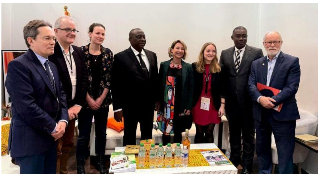
Le ministre ivoirien de l'Agriculture et du Développement rural (quatrième en partant de la gauche), accompagné des représentants de VEGEPOLYS VALLEY, de l'ambassade de France en Côte d'Ivoire et de FranceAgriMer.

Le projet « Accélérateur du végétal en Côte d'Ivoire » (AVECI) a été présenté au ministre de l'Agriculture ivoirien par VEGEPOLYS VALLEY lors du SIA en février dernier. Ce rendez-vous a concrétisé le soutien du gouvernement ivoirien au projet, financé pour moitié par FranceAgriMer. Ce projet a pour but de soutenir et valoriser l'expertise française dans les filières végétales en Côte d'Ivoire. Des actions collectives entre le pôle de compétitivité, les régions, les partenaires publics et privés seront menées notamment lors du prochain Salon international de l'agriculture et des ressources animales (SARA), qui aura lieu du 23 mai au 1 er juin 2025 à Abidjan, afin d'identifier les opportunités pour le secteur et de mener des actions avec nos partenaires ivoiriens.