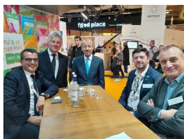
S.E. Fahad M. ALRUWAILY, ambassadeur saoudien en France (au centre).

FranceAgriMer a organisé des visites personnalisées du SIA pour 10 ambassades étrangères basées à Paris (Arabie saoudite, Canada, Chine, Corée du Sud, Espagne, Japon, Pakistan, Pays-Bas, Pérou, Royaume-Uni), en vue de rencontrer différents acteurs du domaine agricole et agro-alimentaire français. À cette occasion, les ambassadeurs et leurs équipes ont échangé sur les enjeux export avec les représentants des filières suivantes : porcine, bovine, volaille, céréales, fruits et légumes, semences végétales, vins et spiritueux, produits laitiers, pommes de terre de consommation, plants (de pommes de terre et de vignes), génétique animale. Des rencontres avec le Centre de coopération internationale en recherche agronomique pour le développement (CIRAD), l'Institut national de recherche pour l'agriculture, l'alimentation et l'environnement (INRAE) et l'enseignement agricole se sont également tenues.