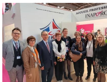
S.E. Seoung-hyun MOON, ambassadeur sud-coréen en France (troisième en partant de la gauche).