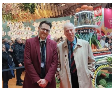
S.E. Stéphane DION, ambassadeur canadien en France (à droite).