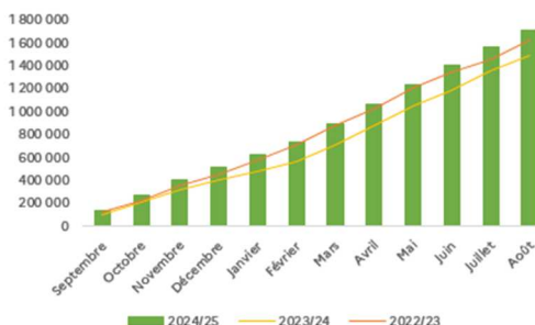
Évolution des importations de l'UE (en t - Eq. Blanchi)

Cette situation laisse penser que les opérateurs ont augmenté leurs niveaux de stocks, soit par anticipation d'éventuelles perturbations du commerce mondial du riz, soit en réponse à une progression de la consommation au sein de l'UE, voire une combinaison des deux facteurs.