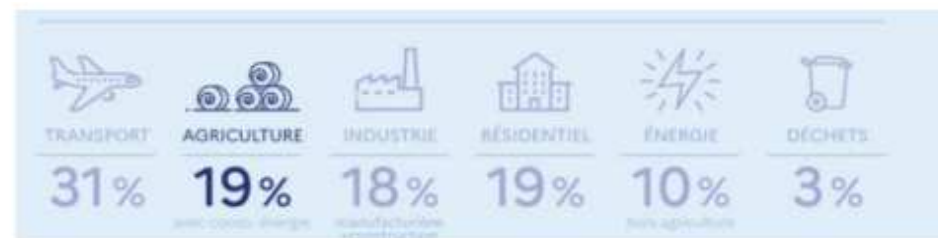
Emissions de Gaz à effet de Serre du secteur agricole français

▪ En agriculture, les 3 principales sources d'émissions directes (sur l'exploitation) sont :