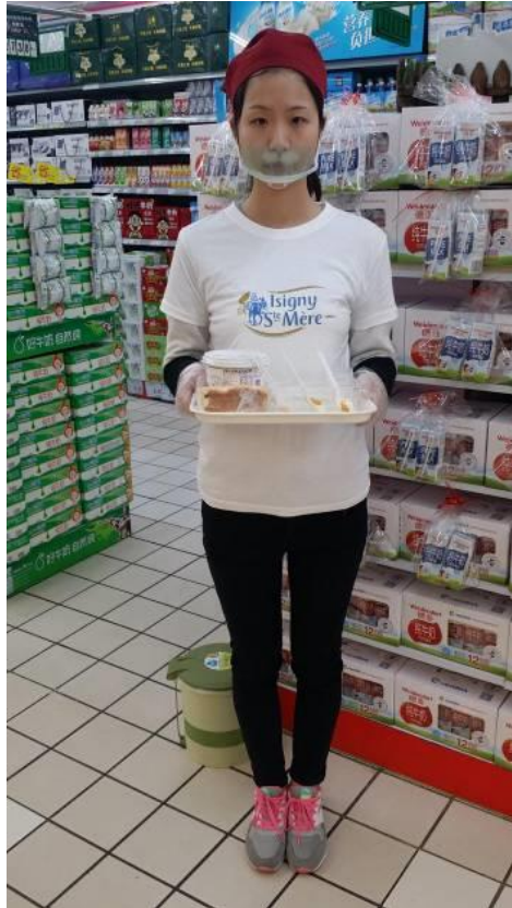
Démonstrations Magasins Carrefour